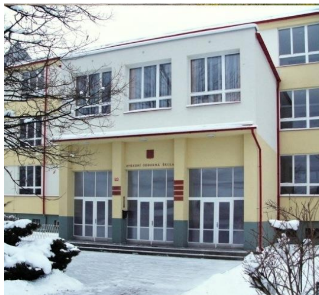
VCHOD DO ŠKOLY V ROCE 2004