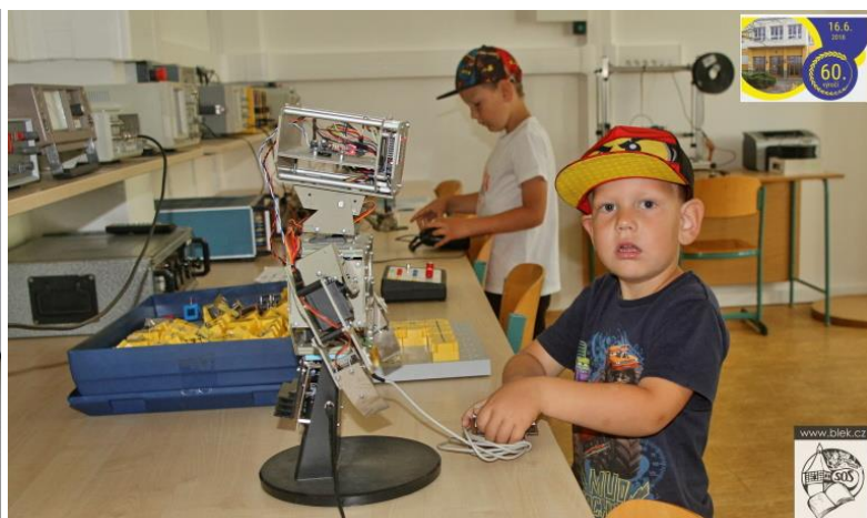
.. a virtuální realitu i robotiku si vyzkoušeli ti zkušnější i budoucí noví studenti 😊 😊 😊