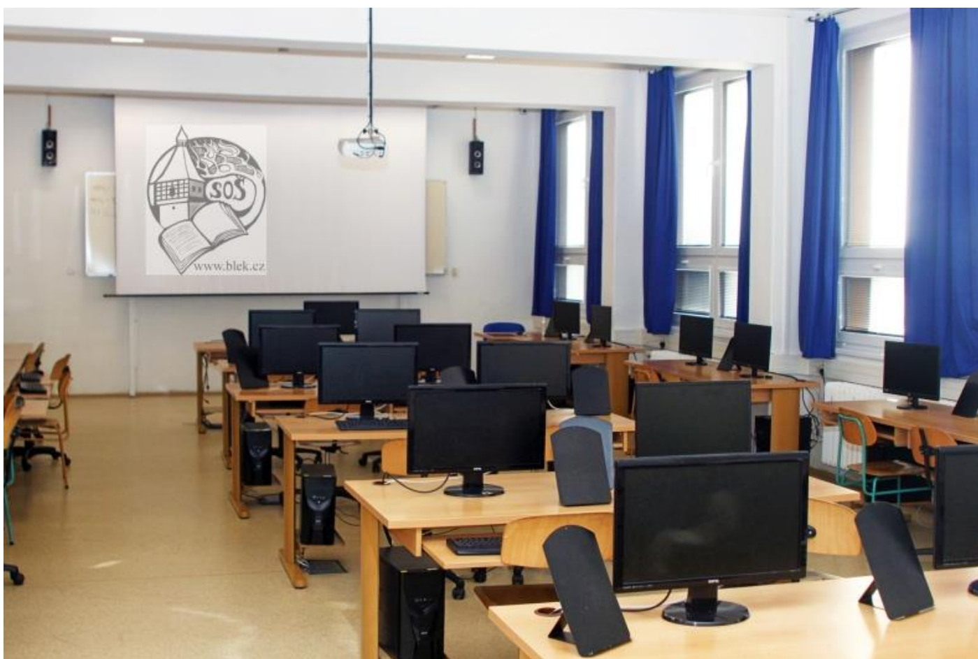
UČEBNA VT3 V SOUČASNÉ DOBĚ (rok 2022) (JEDNA Z 5 UČEBEN VYT, DALŠÍMI „POČÍTAČOVÝMI UČEBNAMI JSOU I DVĚ DALŠÍ UČEBNY PRO ELEKTROTECHNIKY, V UČEBNĚ ELM PROBÍHÁ I PRAKTICKÁ MATURITA ELEKTROTECHNIKŮ)