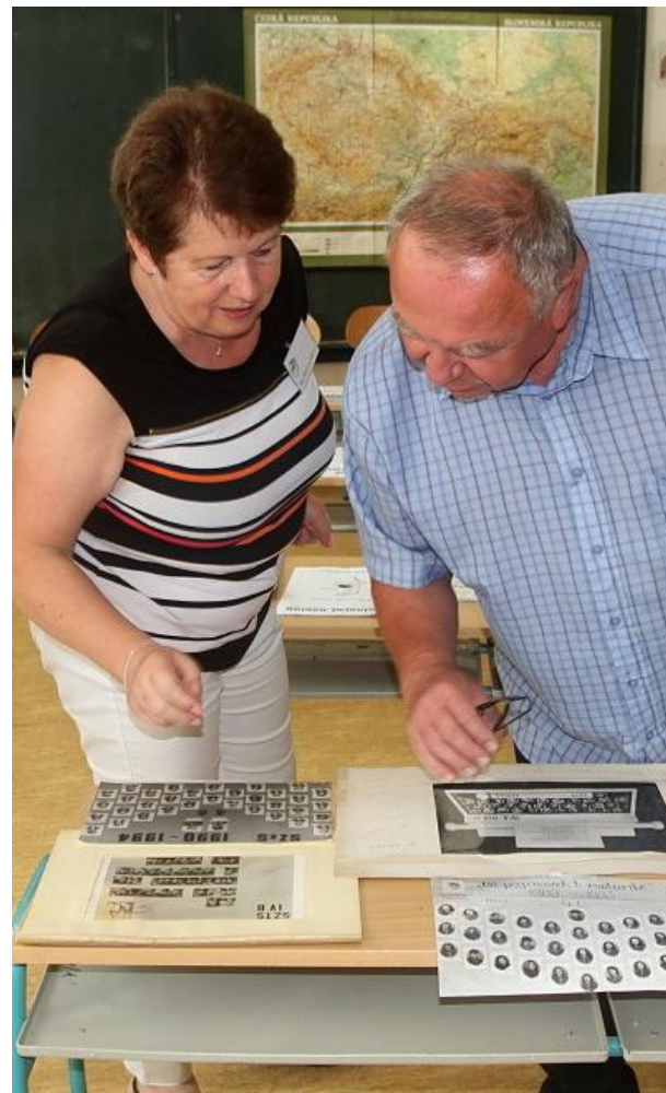
Tři ředitelé společně zasadili lípu k 60 letům školy a století Československé republiky a vzpomínalo se nad zažloutlými fotkami...