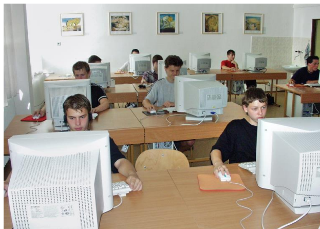
PRVNÍ MATURANTI ELEKTROTECHNICKÉHO OBORU Z ROKU 2003 (TEHDY „ELEKTRONICKÉ POČÍTAČOVÉ SYSTÉMY“) + JEDNA Z UČEBEN VÝPOČETNÍ TECHNIKY, JAK VYPADALA V ROCE 2001