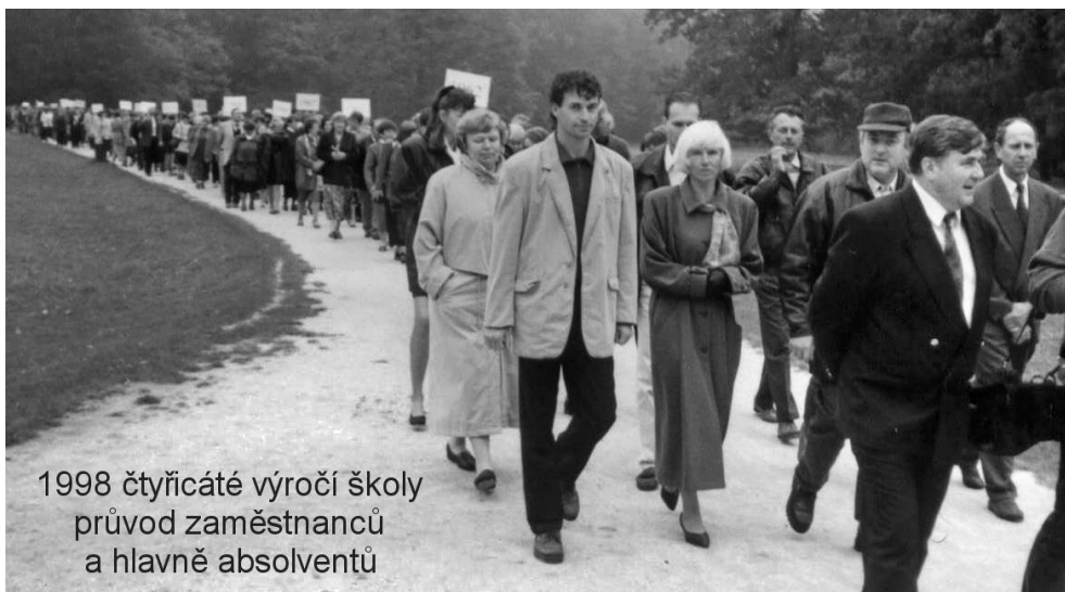
1998 čtyřicáté výročí školy průvod zaměstnanců a hlavně absolventů