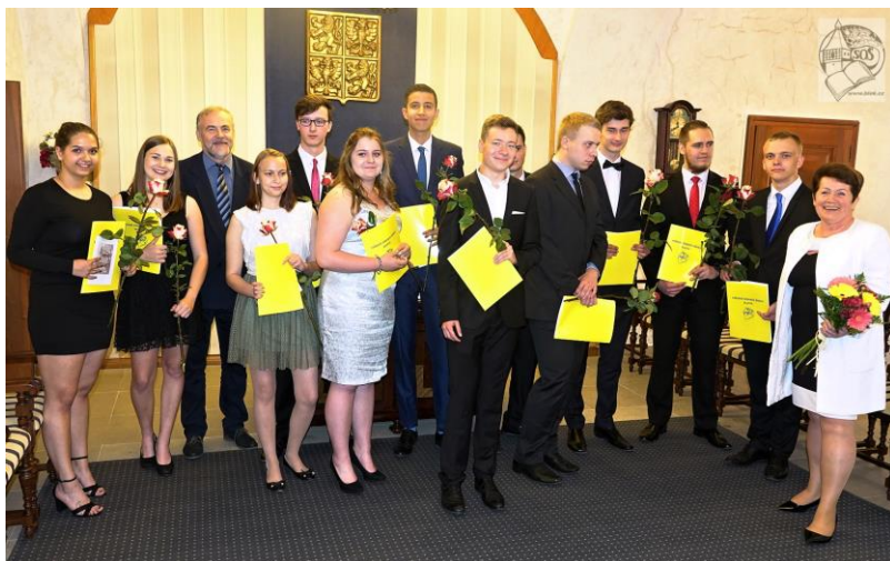
a V ROCE 2023 (dole zbyvajici)