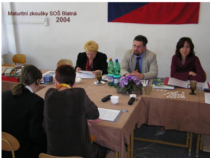
Maturitní zkoušky SOŠ Blatná 2004