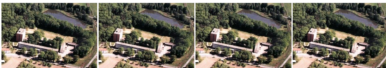
AREÁL ŠKOLY PŘED ROKEM 1999 – PŘED PRVNÍM ZATEPLENÍM BUDOVY DOMOVA MLÁDEŽE