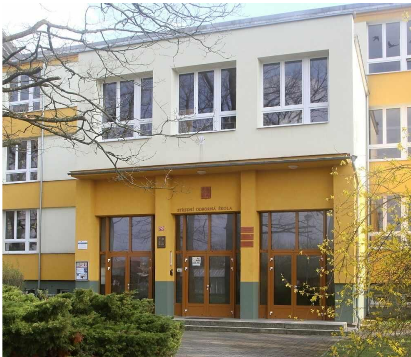
HLAVNÍ VCHOD ŠKOLY A BUDOVA DOMOVA MLÁDEŽE PO ZATEPLENÍ Z ROKU 2014 (SOUČASNÝ STAV)