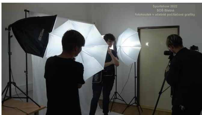
V JEDNĚ Z UČEBEN VYT JE I STUDIO PRO FOTO/VIDEO/AUDIO (VYUŽÍVÁNÍ NEJEN PRO OBOR MODERNÍ INFORMAČNÍ TECHNOLOGIE)