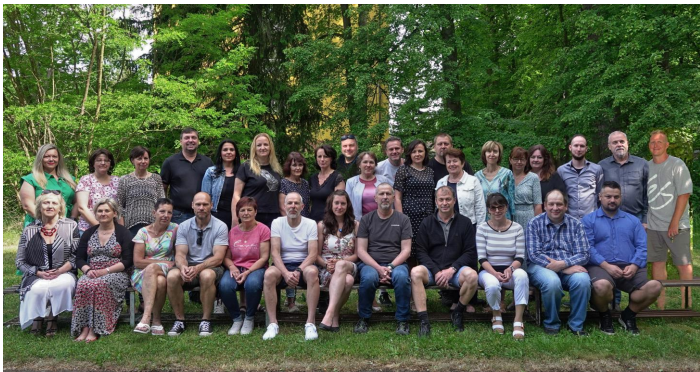
ZAMĚSTNANCI ŠKOLY V ROCE 2023

Počty absolventů školy: za dobu existence školy ji (stav k červnu 2023) úspěšně ukončilo v denním studiu 3378 absolventů ekonomických oborů, 475 absolventů elektrotechnického oboru a 248 absolventů oboru informatika. Dalších 322 žáků vystudovalo dálkově (dálkově pouze ekonomické obory a to naposledy roku 2004).