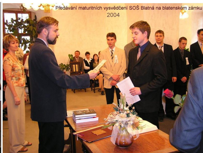
Předávání maturitních vysvědčení SOŠ Blatná na blatenském zámku 2004