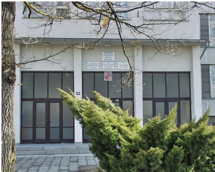
VCHOD DO ŠKOLY V ROCE 2002

Areál budov SOŠ Blatná je popsán textově i fotograficky v minulých almanaších (ke 45., 50. a 55. výročí). Jak plyne z předešlých fotografií, areál byl postupně stavebně zmodernizován nejprve zateplením budovy mládeže (stěn a střechy koncem devadesátých let) a následně i hlavní budovy školy (rok 2003), roku 2013 proběhla výměna plynových kotlů a regulace vytápění (byl využit půlmilionový grant Ministerstva průmyslu a obchodu EFEKT 2013) a v roce 2018 proběhla výměna ohřevu teplé užitkové vody. Došlo k rekonstrukci odvodu kanalizace – zastaralá čistička odpadních vod byla nahrazena přečerpáváním do městské kanalizace. Finančně nejrozsáhlejší akcí byl projekt „Snížení energetické náročnosti SOŠ Blatná“. Během roku 2012/13 se po dlouhé snaze podařilo získat podporu přibližně 10 milionů v rámci Operačního programu životní prostředí z prostředků EU poskytnutých SŽFP na rozsáhlou stavební akci, při které se v roce 2014 vyměnili v celém areálu školy okna za kvalitní plastová a došlo také k dodatečnému zlepšení izolace stěn budov školy a domova mládeže (na dřívější vrstvu izolace přibyla další), zcela nově se zateplila tělocvična a areál učeben výpočetní techniky. Výrazně se tím zlepšila energetická úspornost areálu školy. Předfinancování a dofinancování nezpůsobilých výdajů zajistil zřizovatel školy Jihočeský kraj.