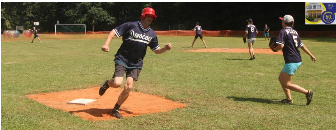
Setkaly se i týmy basebalových Divočáků a softbalových Bangels (které v roce 2003 dokonce hrály 2. nejvyšší ligu 😊)